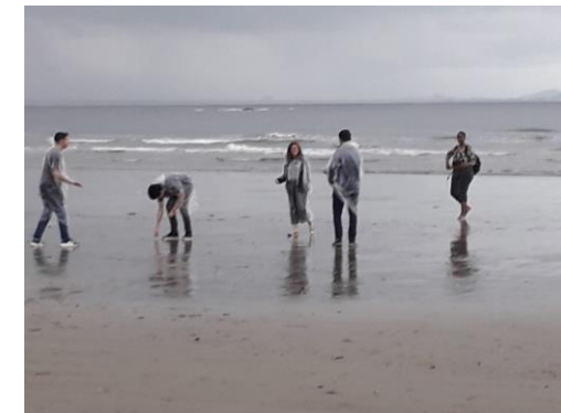
fim de tarde na praia