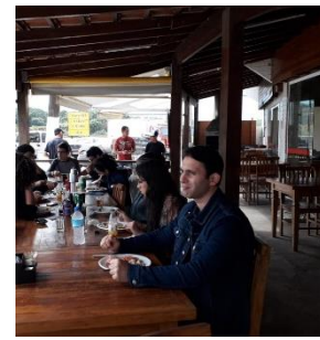
Trilha da Água