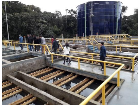
Visita Estação Tratamento Efluentes Riviera S. Lourenço