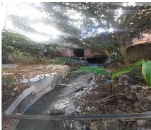
Fotos da Situação atual