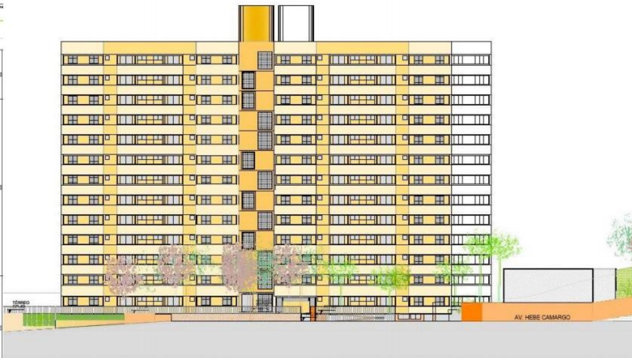
ELEVAÇÃO 1 - EDIFÍCIO 1 e 2 (OPÇÃO T+ 12 PAVS.) ESC. 1:200