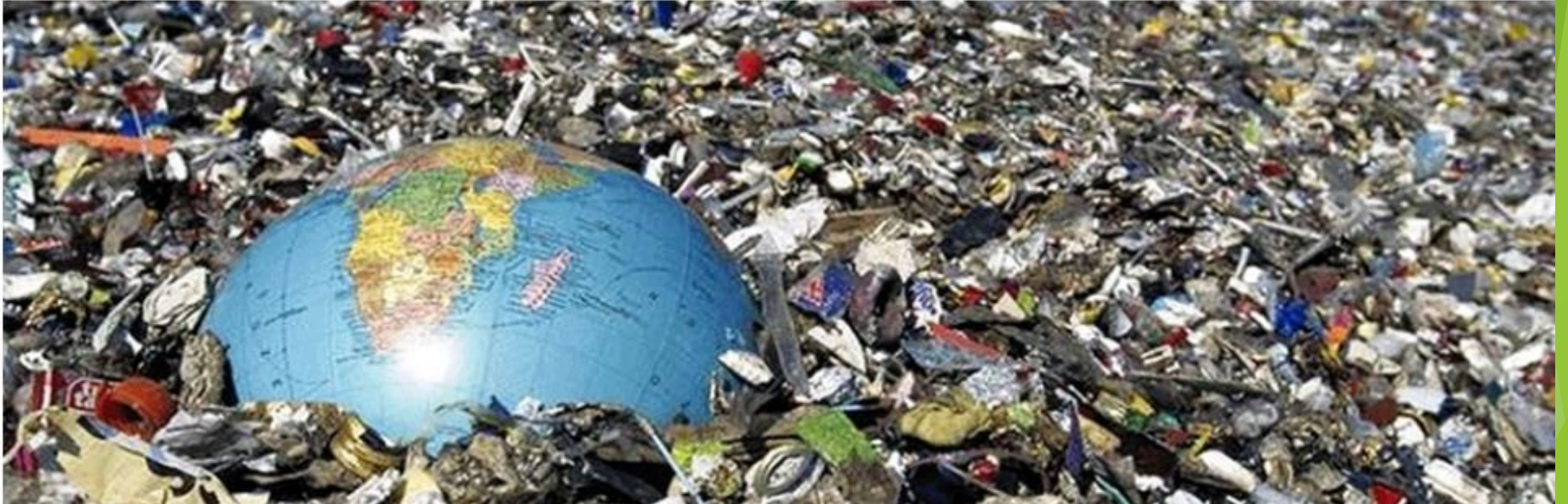
gerenciamento de resíduos